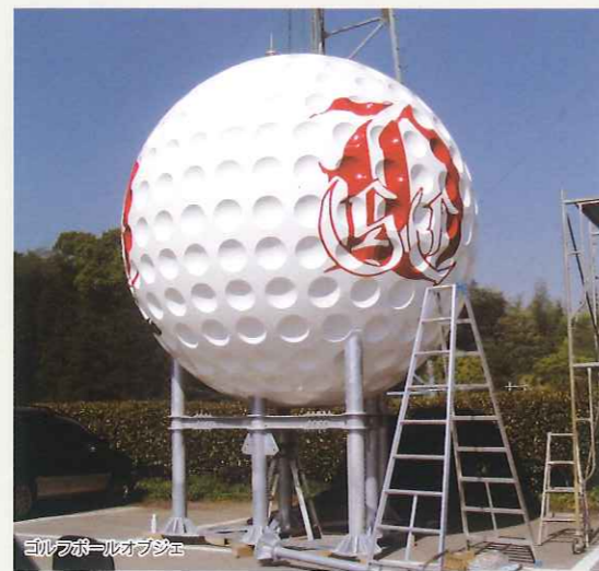
三日月ボールオブジェ