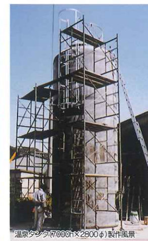
温泉タンク(7000h×2800φ)製作風景