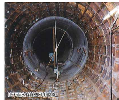
地下雨水貯留槽FRP製